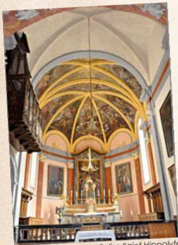
Eglise Saint Hippolyte

1606 : Dans ses visites pastorales en pays d'Evian, François de Sales ordonne partout la remise en état des chapelles. A THONON, le développement de la Sainte-Maison est prioritaire. La chapelle de Tully n'est pas, à cette époque, réalisable.