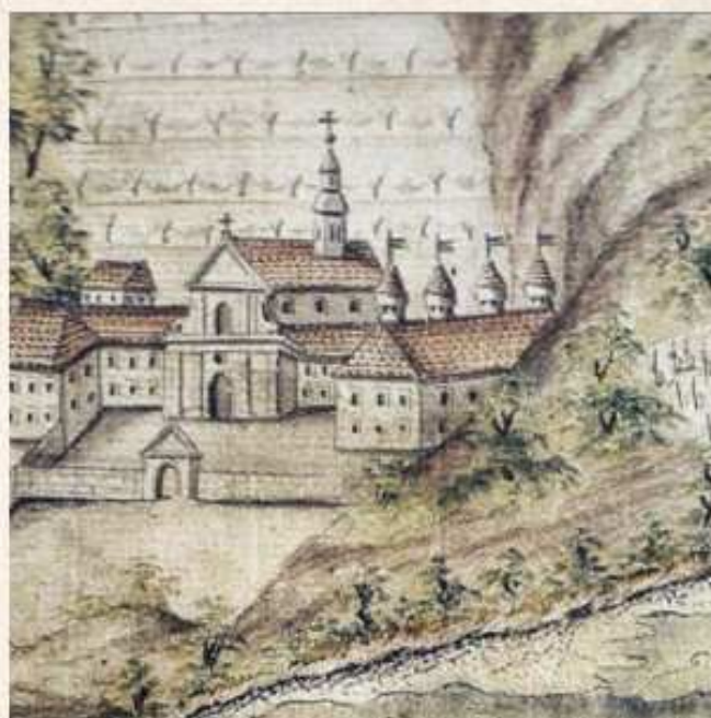
Le château de Ripaille

Au printemps 1468 , le pont de VONGY est terminé ; la maladière est transférée près du pont.