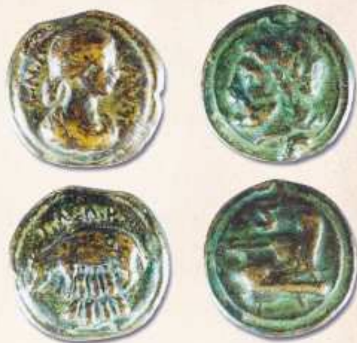
Les monnaies romaines.

En 268 de notre ère, les barbares envahissent le territoire. Puis, les Burgondes occupent l'Allobrogie, en partageant le territoire avec les habitants.