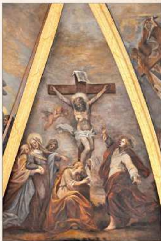
Marie au pied de la Croix

sont en phase avec les positions des humanistes éclairés de ce temps. Mais dans l'esprit de l'époque, cet objectif ne peut se concevoir que par le triomphe de l'unique vraie foi sur l'hérésie, y compris « par les faveurs et rigueurs politiques ».