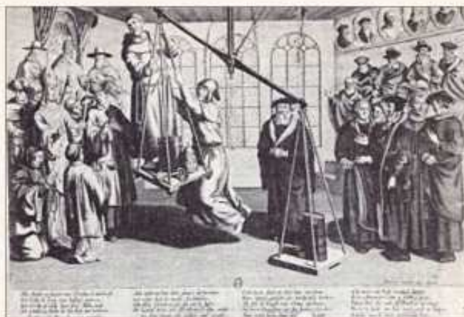
Le triomphe de la réforme

1536 : les Bernois, qui ont adopté la religion réformée, déclarent la guerre au duc de Savoie et prennent THONON le 2 février. En 1539, ils occupent le Chablais jusqu'à la Dranse et y imposent la Réforme.