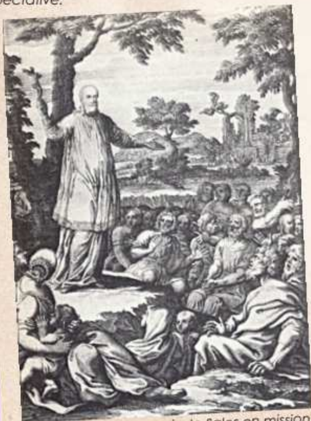
François de Sales en mission