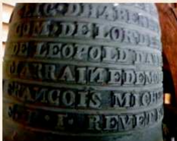
La cloche de la chapelle

1942 : Henri MODENA réalise le tableau du plafond : la lapidation de Saint Etienne.